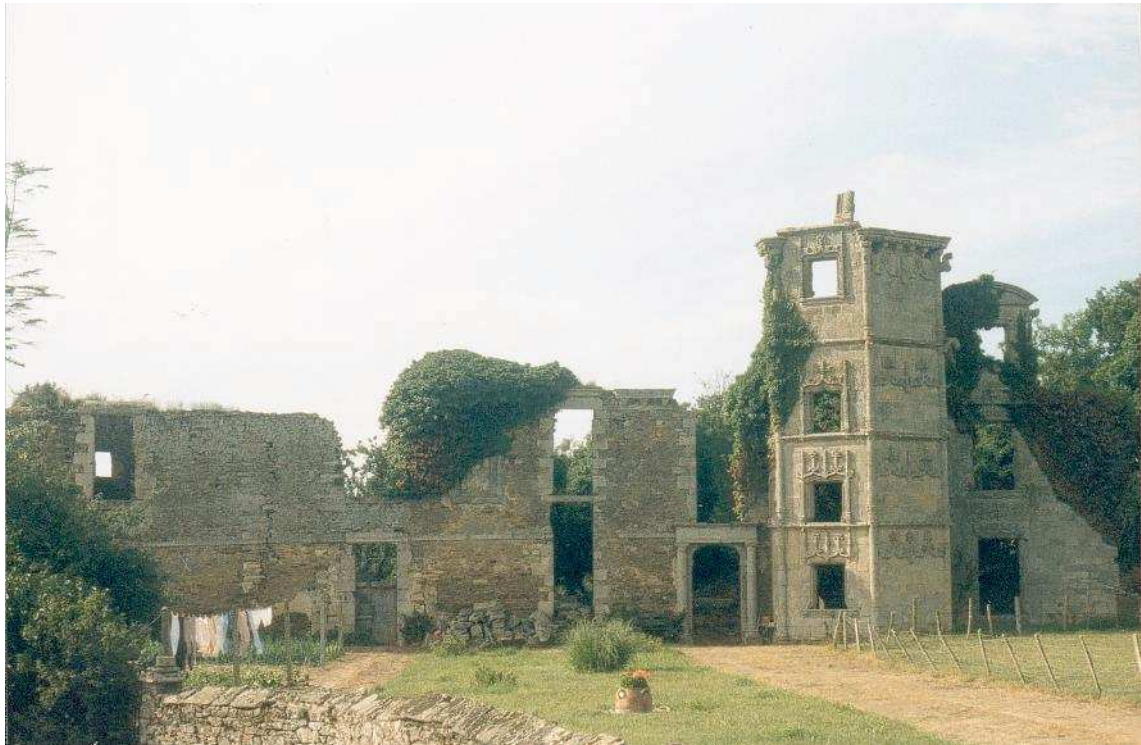
Ruines du château de la Garaye à Taden, près de Dinan